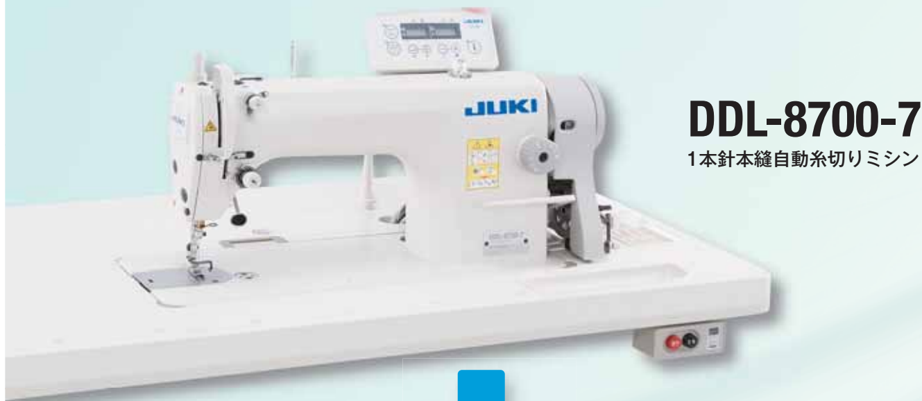
DDL-8700-7 1本針本縫自動糸切りミシン